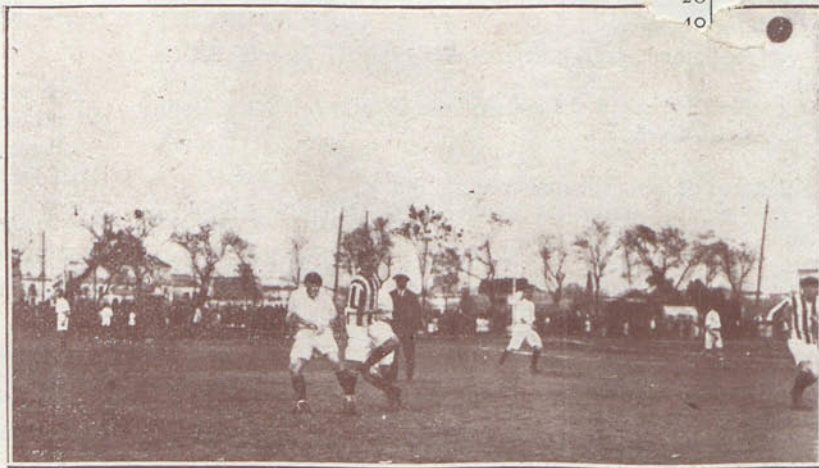
Un momento interesante del partido