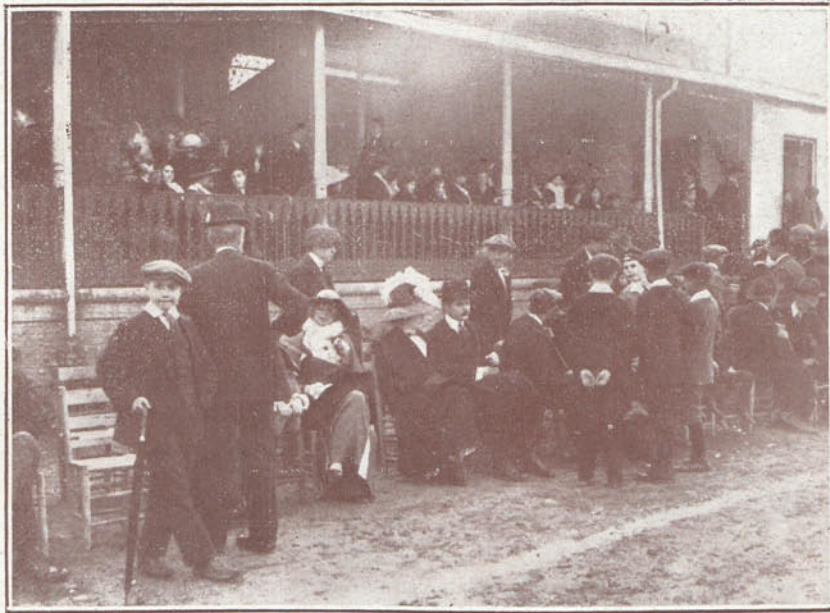
Aspecto que presentaban las tribunas

te los suyos, con su silencio y huida. Consideramos el hecho, reducido á sus mínimas proporciones, sin encontrarle más fundamento y origen que la exaltación injustificada de un individuo, quizás á ello propenso por carecer de algo indispensable aun para lo más minio é insignificante, que ni siquiera dudamos falte á sus compañeros, que como antes decimos, consideraron reprochable el incidente, que somos los primeros en lamentar.